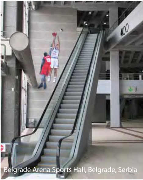
Belgrade Arena Sports Hall, Belgrade, Serbia