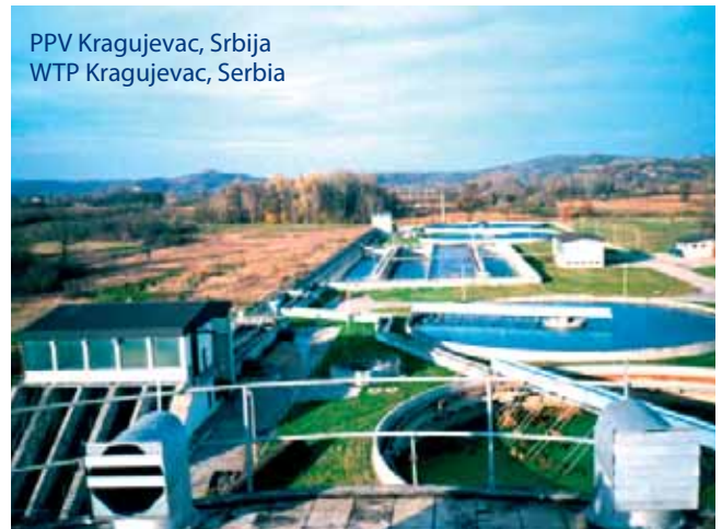
PPV Kragujevac, Srbija WTP Kragujevac, Serbia