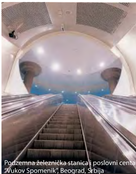
Podzemna železnička stanica i poslovni centar "Vukov Spomenik", Beograd, Srbija

Energoprojekt Oprema garantuje brzo i uspešno ostvarenje svih vaših potreba i zahteva.