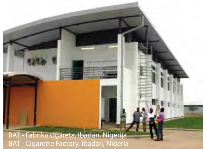
BAT - Fabrika cigareta, Ibadan, Nigerija BAT - Cigarette Factory, Ibadan, Nigeria

For our clients we carried out services starting from feasibility studies, adequate technical solutions for particular type of industry, design over to construction, selection and procurement of materials and equipment, all the way to maintenance, commissioning, post-commissioning services and staff training.