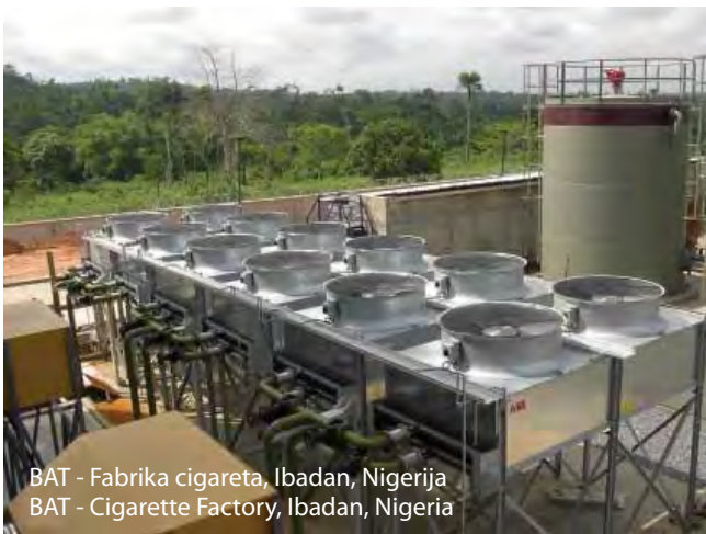
BAT - Fabrika cigareta, Ibadan, Nigerija BAT - Cigarette Factory, Ibadan, Nigerija

Usluge koje pružamo našim klijentima obuhvataju izradu studija opravdanosti, izbora adekvatnog tehničko-tehnološkog rešenja u skladu sa konkretnim zahtevima projekta, projektovanje, potom izgradnju, izbor, nabavku, transport i montažu materijala i opreme, puštanje u rad, predaju, održavanje, kao i obuku kadrova klijenata.