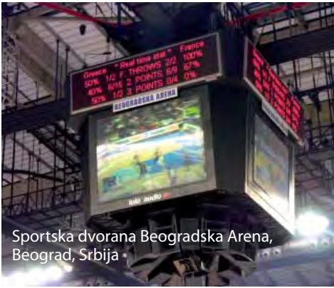
Sportska dvorana Beogradska Arena, Beograd, Srbija

Energoprojekt Oprema is providing electrical, mechanical and plumbing services for various types of buildings: luxury hotels, theaters and television centers, congress and business centers, offices, residential and industrial buildings.